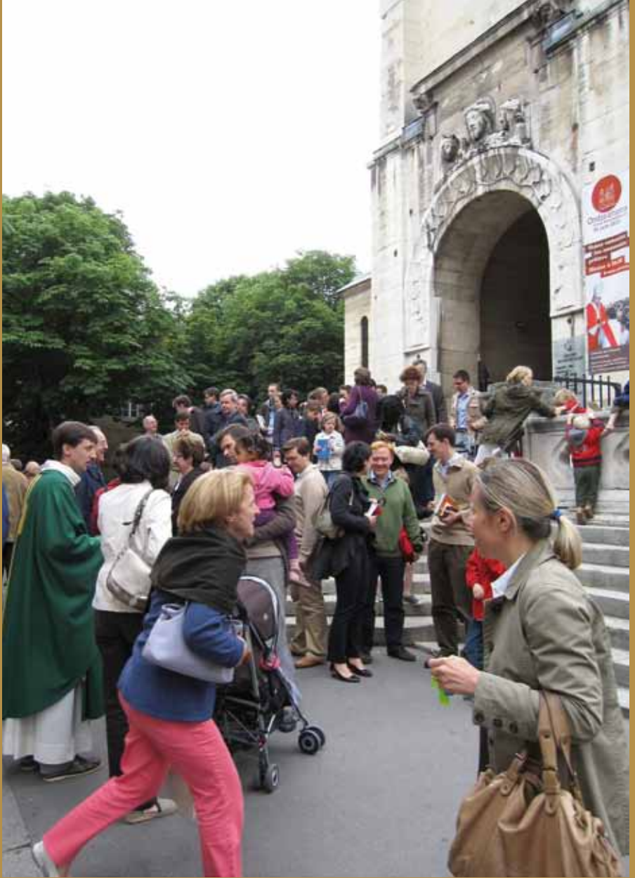
Eglise catholique Saint-Lambert de Vaugirard